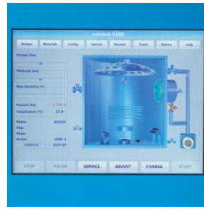
Einfache Bedienung über benutzerfreundlichen Touchscreen