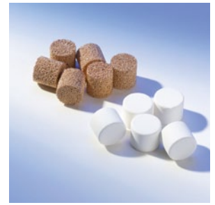
Hydrophobe und oleophobe Beschichtungen verfügbar