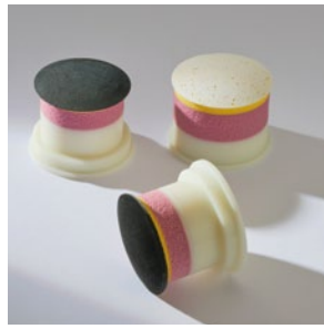
Herramientas de pulido inteligentes con chip RFID incorporada