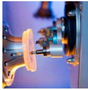
Calibration automatique des outils.