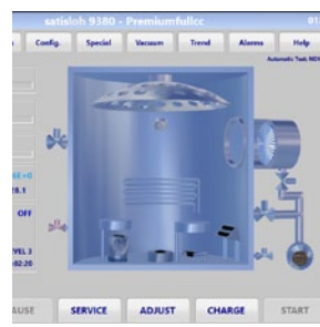
Software HMI de fácil utilização e conectividade com o Lab 4.0 ready