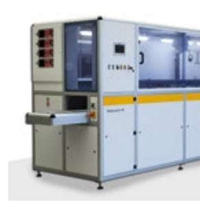
Hydra-sonic-40 全自动超声波清洗系统