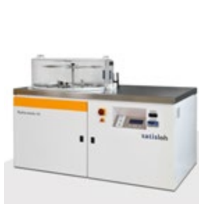
Hydra-sonic-10 紧凑型“即插即洗”系统